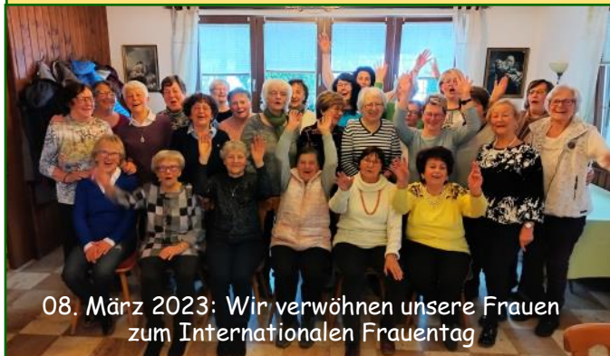
08. März 2023: Wir verwöhnen unsere Frauen zum Internationalen Frauentag