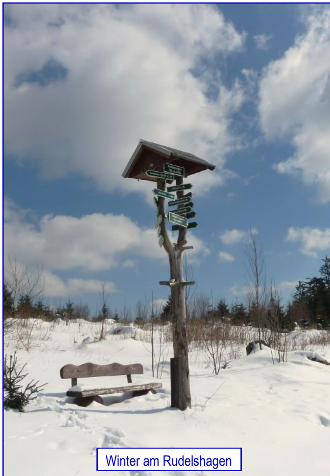
Winter am Rudelshagen