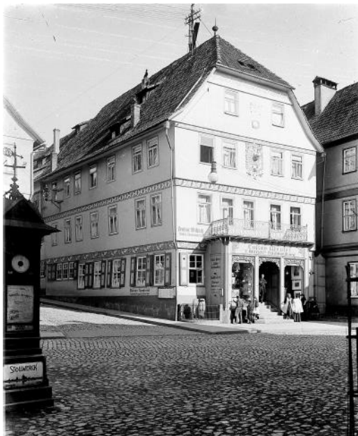
Das Luther- Haus - eine historische Aufnahme