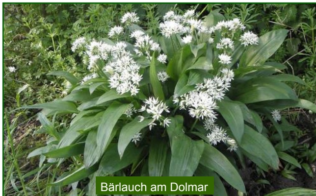
Bärlauch am Dolmar