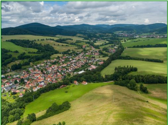
Luftbild von der Queste auf Weidebrunn, das Schmalkaldetal und den Thüringer Wald